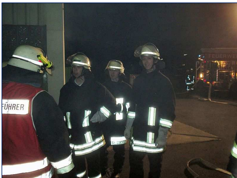
Auch unser Nachwuchs ist mit eingespannt. Meldung beim Gruppenführer...