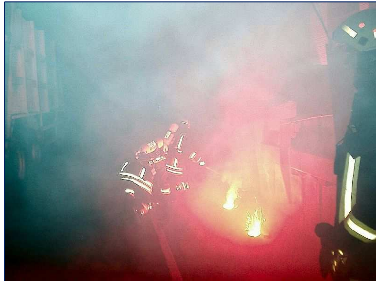
Pyrotechnik macht realitätsnahe Übungen möglich