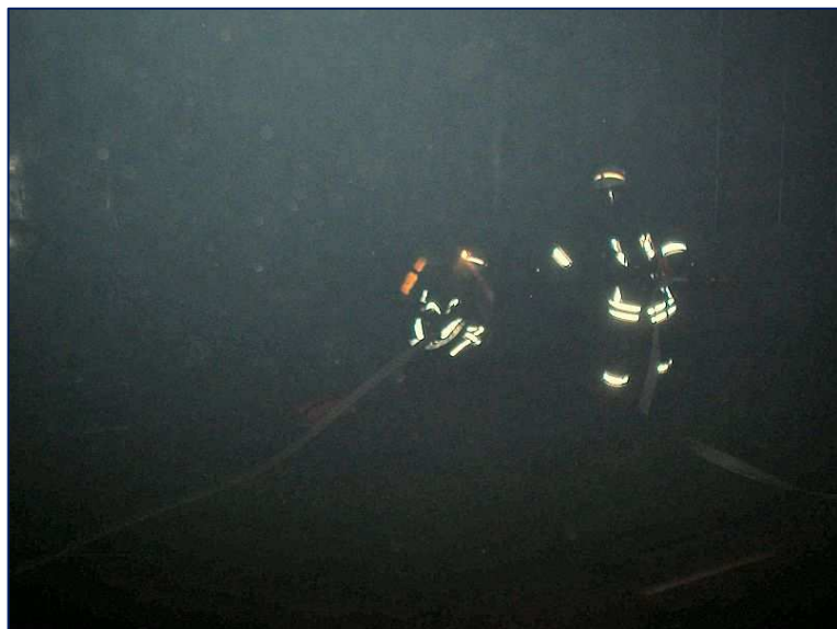
Die erste vermisste Person ist gefunden....