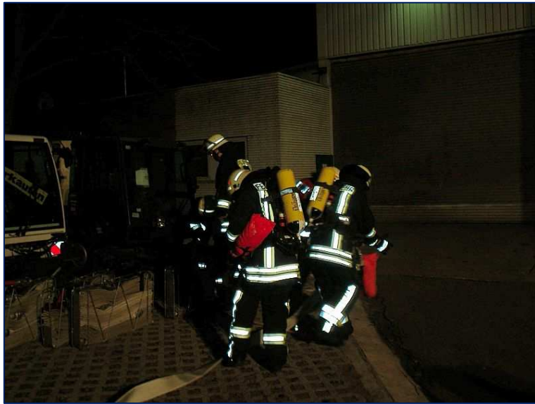
Der erste Angriffstrupp rüstet sich aus- Menschenrettung, zwei Personen vermisst...